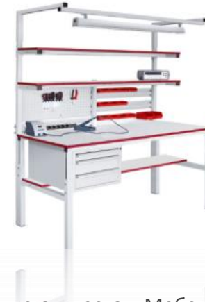
Антистатическая Мебель GRESSION