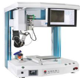
Паяльный робот RUICHI серия R351