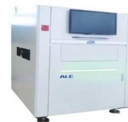
Автоматическая оптическая система GDK серия ALE

Кликнув по фото оборудования вы можете ознакомиться с техническими характеристиками