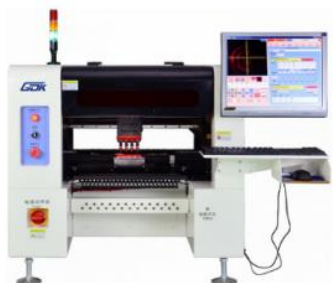
Автоматический установщик SMD компонентов GDK M4-44F

Наши представители будут рады видеть вас и дать вам информацию и консультацию о продукции