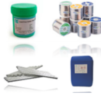
Паяльные материалы NEVO (Чешская республика) и SHENMAO (Тайвань) * Паяльные пасты. * Проволочные припои. * Припои в брусках. * Флюсы.