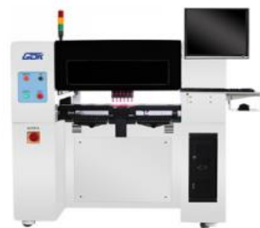
Автоматический установщик SMD компонентов GDK M6-64F