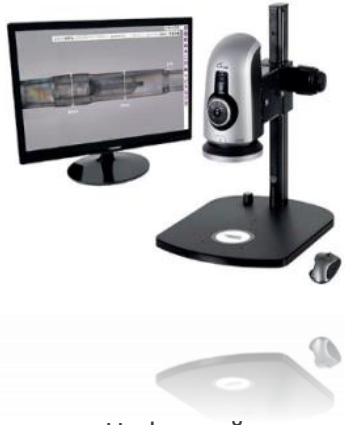
Цифровой инспекционный микроскоп ASH

Вспомогательное оборудование для производства СМТ: