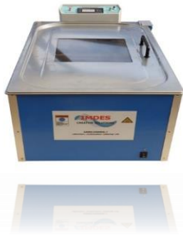
Установка для пайки при помощи пара IMDES JUMBO CONDENS-IT