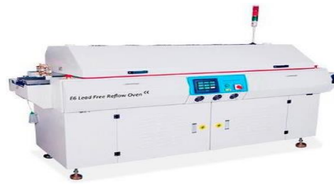
Печь конвекционного оплавления DEKTEC E6