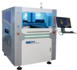
Линейный автоматический принтер GDK X5

Автоматическая линия производства СМТ монтаж: